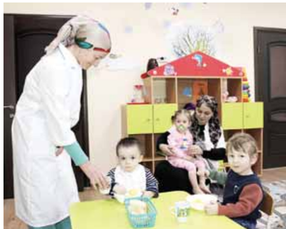
Солдан оннга: Башийланы Мадина тамата юйретиучюдо, Ностулары Лейля уа анга болушады.