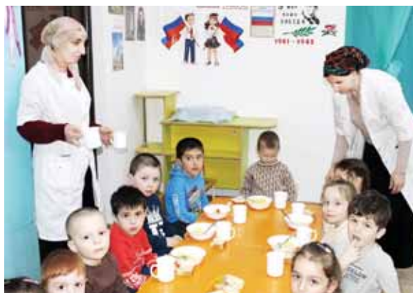
Былай юйретиучюлени хайырларындан сабий садха жюрюгенле ары скойюп келедиле.