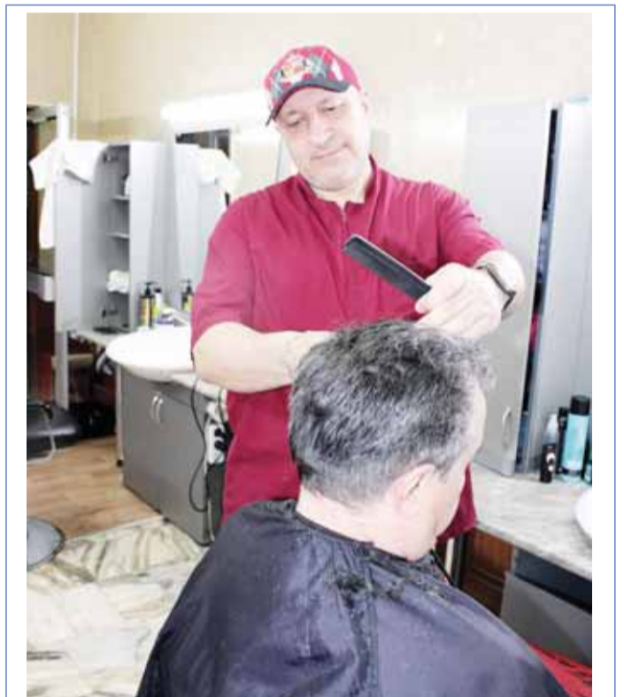
Суратны МАМАЙЛАНЫ Алий алганды.

Нальчикде инсанланы шахарны ичинде транспортда жорютюу бла байламлы инфраструктураны жангыртуу жумушланы тамамлагъанларыны юсюнден жалган документле хазырлагъандыла. Алай бла къыралгъа