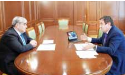
жабылган кёпюр бла кышулуукду. Басханда уа ара район больницаны хирургия мекемеси ишлене турды. Тынгыла ремонт ишле Баскёнюк

Жаңгы амбулаторияла Сармаково, Къуркъужин эмда Черепал Ренка элде ишленди. Чегемде уа бир кезимте 300 сабийге кыаргъаа кючю болуукъ поликлиниканы кырууш башланганды. Заюковада район поликлиника жаңгырыла турды. Аны кытында уа анга жаңгы мекеме ишлене турды. Ол, келгени сауузга кызыл налмас ючюн, поликлиникага башыла