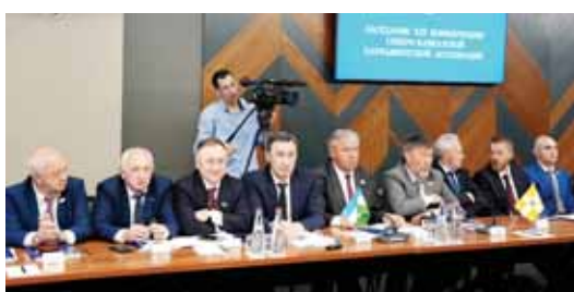
Совет магъаналы оюнуу чыгарганды: Шимал-Кавказ парламент ассоциацияга келир кезимде Къабарты-Малкыар башчылыкъ этердик.

Каспийск шахарда Шимал-Кавказ парламент ассоциацияны XIII конференциясы этгенди. Тохташдырылган нызамгъа тийишлиликде, оу бирингеу башчылыкны регионла кезим-кезиму этдиле. Быыйл а Шимал Кавказны субъектлерини парламентарийле Дагъыстан Республика кыонакбайлыкъ этгенди.