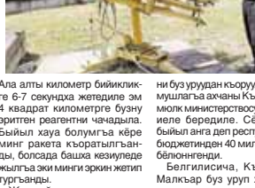
Ала алты километр бийикликте 6-7 секундга жетедиле эм 4 квадрат километрге буюн эртен реантими чыкканды. Быйыл хауа болупмага кере минг ракетка кьоратылганды, болсода башка кезилерде жылгга эки минг эркин жетип турганды. Жыл сайын эл молк жерле-

кёкге эни устройстволандан регентлери бла ракетала жиберишкенди. Алачы хайыр-чага жерге буюн орунуна жуун тамыкыла аг-адыла. Кавказын аскер службасыны Урван райнда бөлгөнмөн таматасы Валерий Кьабардов айтыганга кьре, буюн буюн ала ракеталаны Алазандь, 6, 7, 8 торлоерини хайырландыла.