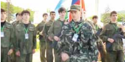
Юлрениуле башларны алдында КМР-ни жаш тейлону иштери жаны бша министр

Бу кюнде Ак-Сууда «Кавказ» солуу лагерде абадан класснаы окуучуларыны адалдыга бешкюнлук жаратуу-юлрениуле бардырылгандыга. Бу жол алага беш миң чаклы адам кытышканды. Бу ишин мураты жашланы башланган аскер хазырлыккыга, командада иштерге ама, керек болса, бир бирге болушкы этерге иштейтуду.