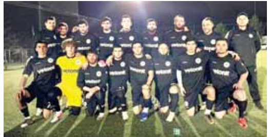
Келгенди. Янкойчулгаг- а быппай эсеп кылырга аз да жарамды эди. Нек деген- де арт оюндо ала очкоосу кылып тургандыла. Алай бша жашла, битен кочерин жыйыл, эсепин 4:3 этип, тур- нир таблицкада 13 очко бша 7

Ыйкыны ичинде респу- бликаны бийик дивизиону юнларны 9-чу эм 10-чу кезилери этгенди. Алай бша мALKAP- ален - «Логоваз» бша «Ян- кой-1961» 9-чу турда Кыш- хатауно туп майданымда тубошени эдиле. Жауунга да кырамай, оюн кочлоу халда этгенди. Багыттал- лени кеш жерлеринде хор- латурга соймгеннери ке- рюнюн тура эди. «Логоваз», кыонкалыга ал бермеге итинги, бу тубошенин 3 очко алып мураты болады. Янкойчулудан сынамы улгу болган кыауум, не да этип, хорламны ычхындырмайды. Бу жол «Янкой-1961» кеси кыярылыбын 3 толгу жиб- береди.