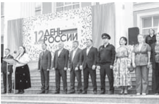
Шагьатлык этген биринчи кыагытларын, паспортлана кыууанчыларын халда тудургандыла.

кыагыт бля белгиленгенди. Элбрусну Кыар юзюнолуе кыажу аскер орданды келечилери да ишлерине жуууалыкчылары ючюн саууулангандыла. «Элбрусские новости» район газетини редакциясы да району жашуну тынгылы ачыклагыаны ючюн 3-чу даражалы дипломга тыишили болганды. Беджини бля 5-чи номерли гимназияны устазлары бля юнамичилары «Зарница 2.0.» ююну регион урумунда жетишилери ючюн саууулангандыла.