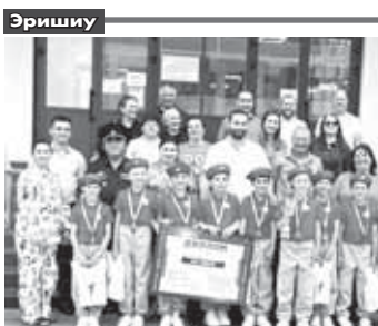
Отарланы Керим атлы 1-чи лицейини «Жомак» сабий садан «Жылы сабын» сэдэн деген Битеуроссый эришюмдө