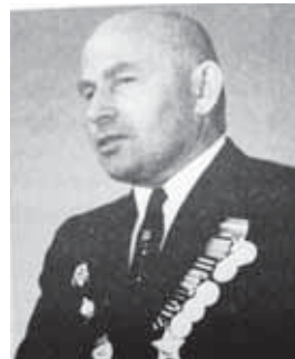
(Кыулбайланы Алиини «Кишилиги сыналгъанда...» китабындан.)