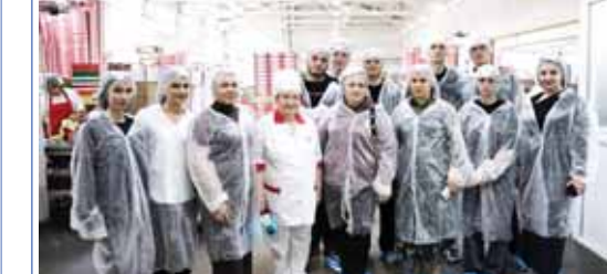
Бу экскурсия жаш къоноклары усталыкларынын ёсдюрюу жаны бля магнаны атам болганды. Нен дегенде ол алага экспорт стратегияны жашауда жетишили бардырыну керти юлюссон, ма аны юсюнде кьорюге эмида шведого уруну рынокда кылай унерле кыленгенде ири аныгъарга юн бергенди. Былай шагырейнену жуулуша жаш тьюде башка

къыралла бля сатыу-алуыга сейр къозгъарга себеплик этедиле, миллет эм регион проклетни жашауда бардырыга тири къатышарга кылдырадиле. Бу жуушуну КМР-ни Эко-