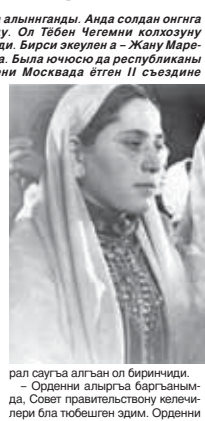
рал сауга алган ол биринчиди. – Орденни алгырга баргынымда, Совет правительствонө келечиле бля тобушен эдим. Орденни

Калмыкыс атлы колхозуну сют-товар фермасы Амхалтаны хуторда орналганды. Чажу анда ийнек саууп, төнгөргө колго көргөзүу урунганды. 1936 жылда хутордун биринчючюн «Сыйлыккыны Белгисин» орден бля саугаланганды. Аны бергеге Чажуу Москвага чакырганын эдиле. Тауу тириликаны араларында бир тоорушлык кы-