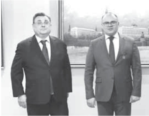
РФ-ни юстиция министри Константин Чуйченко бла.

- Биз ариу, сейир табийгаты болган республикада жашайбыз. Адамларыбыз жарыкыдыла, кыонакбайдыла. Мыйыны уа жылы кезиюне кере тазалайма. Кышда - тау лыжалда учуп. Аны