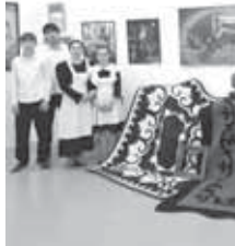
Махити суратын да ишлегенди. Анга «Водоушеватели» деп атап, жалаңда бир өздө алимге улуу хурмет этпегин, сый бергенин, жоржырсылыгын эди да билдиргенди.

Кылодун уста Эздөланы Амин а буюнгоно амаланы хайыранганды. Бу көрмөчтө Хайыраны Мусуну кызыды Суратчы Тамбийланы Букан алм жашыбыз Жүрүбүланы Мухити улуу хурмет бла эгертип, ол художниктени нартланы суратчыны ишере келгендерини турганын айтканды. Эки көрмөчтө да жашауда заманга кыурачу улуу алмичи хурметине атпагандары да эсе салганды. Аны бла кылапмай,