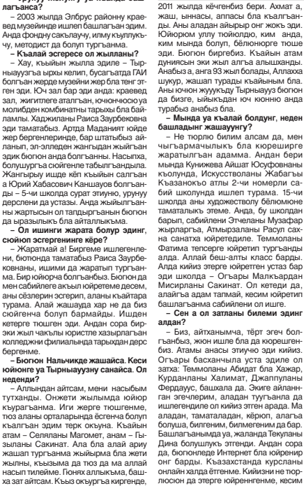
Ушакны МУСУКАЛАНЫ Сакнат бардырды.

— Ак-Сууну школдуна кийизге юйренгенге көлмөчлөдө? — Буюн юноч сабийм барды. 4-ноч классны алгачыма бусугатта. Бирок кыурачулулу эси сору, ийнеме... Алай а, сейне этерге, кылайт уста кыулула бардыла ол гиче сабийчикини араларды Улуула атпалмазкыны этпедиле. Хар класс юч жылы ичиде юйрөндү. Жылдан эки жер өчтү барды. Анда көрүмөч этпегенди. Кийини торлю-торлю теректөдө этерге юй-