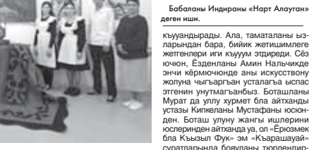
Баболаны Ифанды «Нарт Алуагун» деген иши.

Малкылары суратчыла, колдондалган усталары ишери да тийиши жерин алгандыла. Хар замандан, Бачыланы