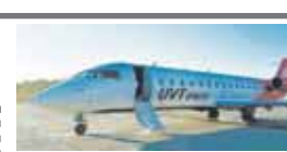
болганы бла байламлы тамамланлыкты. Аны хайры бла туризм жаны бла республиканы араларында кыйматлы байламчылык кючлөрү эм кынокканы санама да кошушура этере болуктуу. КУРДАНЛАНЫ Сулейман.

Бу кюнде «ЮТ АЭРО» авиокомпания «Казан-Нальчик-Сочи» деген тюзюнлей рейсин ачканды. 50 олтурму жери болганы хауа кеме ийыккы эки жери - барас бла шабат кюнде - учарканды. Аны июсунде баштаган Татарстан Республикасына Транспорт эмда жол мюлк министрствосунда билдиргенде.