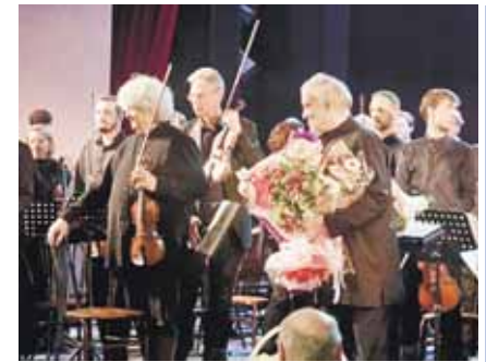
художествону башчысы эм баш дирижеру болуп турганды. Музыка адамлары, шакарлары, кыралланы, халкылары бирлеш-

ары да биз Нальчикте концертте бла келирбиз деп ишанабыз». Пасха фестивалы 2002 жылда Валерий Гергиевнин башламчылыгы бла кыралганды. Быйыл онунчу майга дери барлыккы, кырк шакарда концертте өтөрдиле.