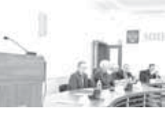
Адамланы бир талай кышумна себеплик этиу иш буа бардырлады. «Жашуу журтла буа жалчытылынырға тиийши инсанланы ол жаны буа онгуртуула бытыр 59 миллион сом кыратылганды. - дегенди министрни куйлугуну топулганы. - Аны буа кырал 66 адамга кой сатып алырга болушканды».

Биз фермане алганды, не шифрлери, не терезелери жок эдиле. Аны сөбелги башын кырып, ала буа жалапхань, пластик терезеле салганыбыз, току тартырга он болмаганын станция алганыбыз. Ол бизни била жетер келти бир жалчытады. Жолу да, уун болганылыкка, жыл сайын жангыртырга тошеди. Таш куюп тозынгетиле, мурдуру тынгылы болмаса, рахь жанаула тозурмай коймайды.