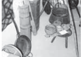
Рашид бичени жашауубуздан ахырын кете барганы кийизлени халкыла арала, битероссе он каква байрамлада көргозотп башлаганында, жаш тейоно инанларыбызны кыюл усталыгына хайыры алай бийик болугун билгендиде. Сыналган шарт: бир ахшы ишн өзүндан жокко чыгарды. Республиканы элчилериде кийиз этген кружкала ачылганды, жамауата озган өмөрлөрдөн бичи заманга дерн жеткен кыюл

Оруубийланы фортепианолу окуна барды муурады Тават а таулу Таулу тишчирүүланы кычмала этген таулу. Калининградскаа орамда, алтынчо номерли юйде кырачарай халкыны музейи ачылганды. Сөзюсүз, берки битум ишчилени адамлары келпелдиде, Россейден да, тыш кыраалгандан да. Ююме суну журтундай, аламы адмалы келген культурабызны жуталык тоюлдо, Локия улу чакырганды болган кыраарды.