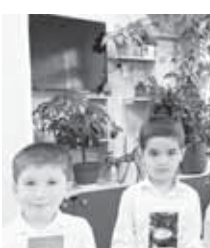
Ангылахнама таулупа кимле болганларын.

Биз а аны бла эришүүнө, ишини юсюнден да ушак эттенбиз.