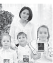
Ангылахнама таулупа кимле болганларын.

Эришүүнө кезиңде кесинге бир жаңы азы ачканың, сейир этпегени а болганмыда? Кертиди, былай жере берсанг, көргөн, эшиткен затларың сейир болмай кыламдыла. Сөз ючюн, Росседе жашаган халкыларың миллет жыйрыкларыңды, аланы накышларыңды, окурларыңды, бир кезеңде кытайлы магвананы тутканыларың юсюнден билдирүлүлени барына да союп туңгылаганам.