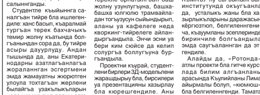
Суратны МАМАИЛАНЫ Алий алгындаы.