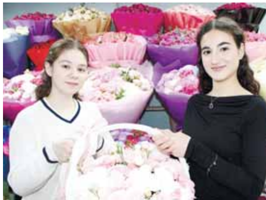
Рахайланы Дарина бла Курданланы Инара «Амир» ансамблде тепсеидиле.

Багъалы тишируула, битеу жүрегимден сизге саулыкъ-эсенлик, жетшилме эмда ырахатлыкъ тежейме. Бу жаз башы кюн сизни жүреклеригизни къууанч эм насып бла жарытсын.