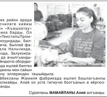
Суратланы МАМАИЛАНЫ Алий алганды.