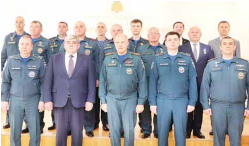
кетерилгендиле. Ведомствону ёчёлтюрге 2500 кереден аслам келечилери от тошген жерлени баргъандыла эм авария-къутхариу ишлеге да къатышхандыла. Битеу айтылгъан жерлеге къутха-

Озгъан жылда республикада беш къыйын болум болгъанды эм тёрт кере социал магъанасы болгъан къорктуу чыкгъанды. Ала барысы да МЧС-ни кючюу бла