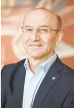
стерствосуну Н.И.Пирогов атлы университетини сыйлы грамоталары бла кеп кере саугаланганды. Россейни бек иги врачлары берилген «Призвание» саугъага да тиийши болганды. Анга ол сый келпелени жашууга къайтарганы ючюн берилгенди.

Медицинада кеп жылланы бет жарыклы ишлеп, атын иги бла айтдырганы ючюн таулу жаш РФ-ни Саулыкъ сакълау министри