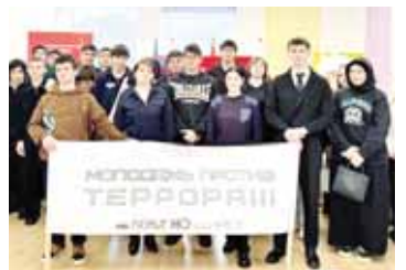
руула бергендиге, кесирини оюмларыны айткандыла. ТИКАЛАНЫ Фатима хазырлаганды.

Элбрус району студенттери терроризмге бла экстремизмге кыажуу жумушалага кыатышкандыла. Акцияны Россейни МВД-сыны район бөлүмюню полициячылары бла жаш тейю араны келечилери бирге кыуагындаыла. Тобешиде экстремизм жамауатка салган кьоркьула уа курт юзюлгөнүндө ниетле кылай жайлыгандарыны юсперден айттырганды. Жаш адамлары бу аманлыкчы кыаууулага кимле эмда кылай тарткандарын, Уголовый кодексге көрө аны ючюн кылай жууаплыккыга тартырга болуугун ангылатууга энчи эс бурлганды. Жаш адамлага кыажуу