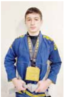
Кылай усталыккыны алыр муралысы?

– Алгебрагы, геометрияны эм физиканы. Магъаналы эришүүдө бек бардыгы кыайын ангылды. Школдан жибергенери ючюн энчи ыразылыгыны билдиргери союме. – Окууну бошагандан сора уа,