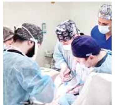
сауусу юйюне жиберилгенди. Энди урология жаны бла кыйын саусууга, башха кыайынга бармай, бизде да, федерал араладача, тийиш медицина болушукта таптырдырза он болганын өтхемлени айттырды.

Көп болмай Республиканы онкология диспансеринде урология жаны бла саусууга бир жолга төрт операция эттерге тоштенди, деп билдириледи КьМР-ни Саулык саккау министрствосуну пресс-службасындан.