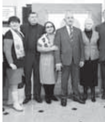
— Илхам кыайдан келеди? Назму жазуу не береди санга?

— Акъ Сыртдан манга дери — сени вузунг» деген халпарын халкъга бек жууксуду. Ол кылай жазылганды?