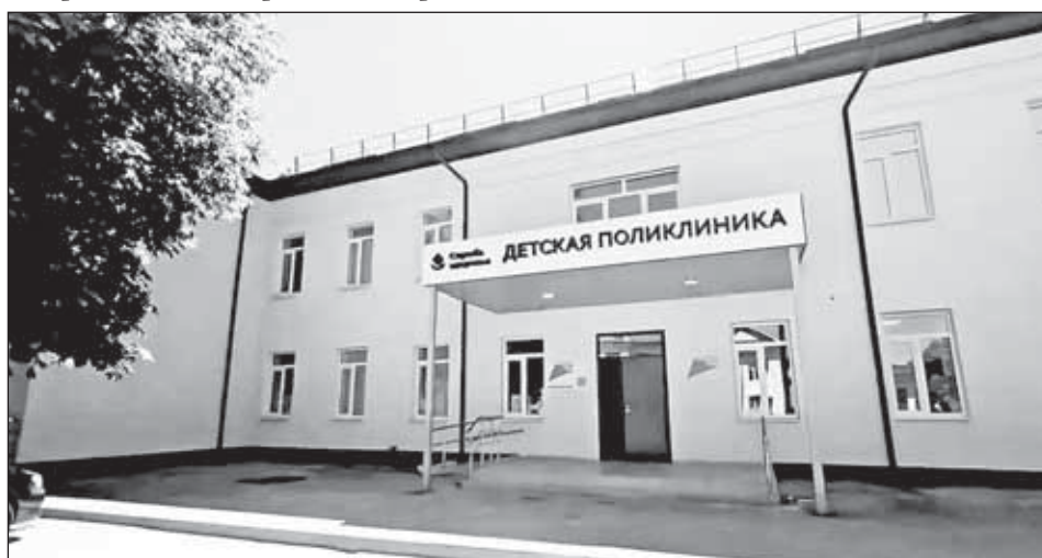
В Нарткале после капремонта открыли новое здание детской поликлиники.

Как сообщили в Минздраве республики, ранее у детского отделения не было собственного здания и прием детей проводили на базе межрайонной многопрофильной больницы. Это было неудобно и пациентам, и медперсоналу. Для улучшения положения решили выделить детской службе и отремонтировать здание бывшей районной поликлиники.