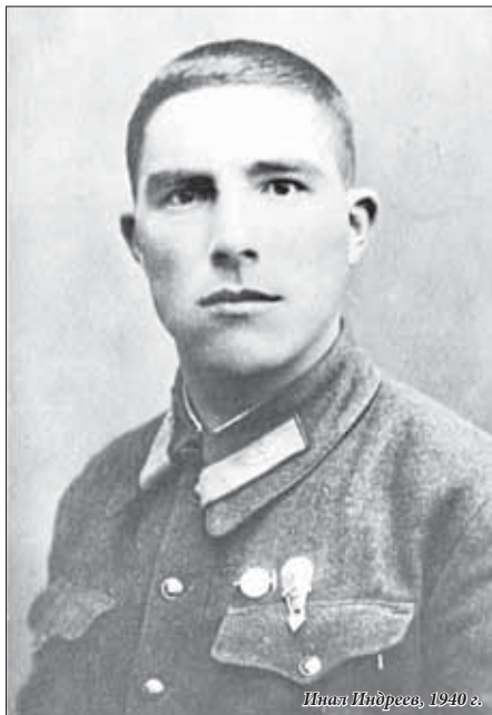
Инал Индреев, 1940 г.