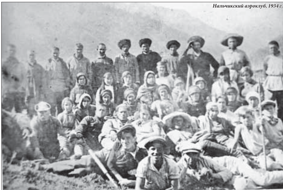
Нальчикский аэроклуб, 1934 г.