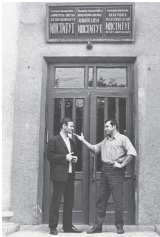
Гутыж Борисрэ Хьэфыцлэ Мухьэмэдрэ. 1966