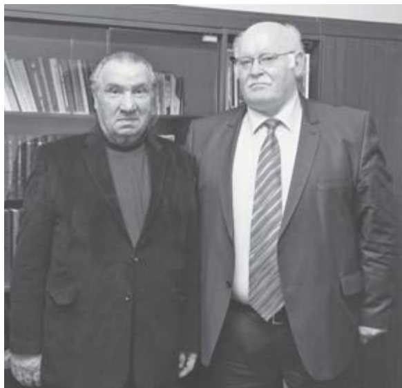
МэшбацIэ Исхьэкъ деж щохьэщIэ. Мейкьуанэ, 2003