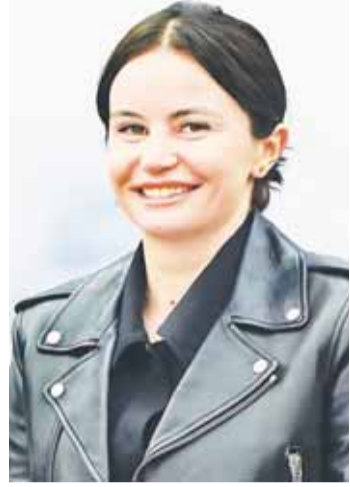
получает официальный статус.

После подачи заявки начинается длительная процедура проверки. Необходимо предоставить полный пакет документов. Все материалы проходят многоступенчатую проверку, а при необходимости запрашиваются дополнительные доказательства. Только после этого рекорд