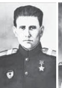
Герой Советского Союза Г. Д. Воровченко (1911–1943)