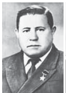
Герой Советского Союза С. Я. Муругов (1911–1980)