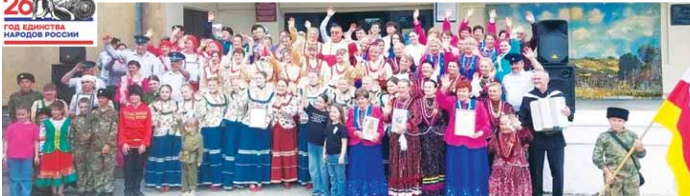
В станице Екатериноградской состоялся межрегиональный фестиваль народной песни «Когда поёт душа народа», приуроченный к Дню славянской письменности и культуры и Международному Дню соседей.

Отдел культуры районной администрации, екатериноградский центр традиционной культуры и станичная администрация постарались сделать всё возможное, чтобы праздник удался. Площадка фестиваля была выбрана не случайно – станица Екатериноградская известна своими традициями и уникальными историческими объектами: Триумфальной аркой 18-го века, Евфимиевской церковью, построенной в середине 19-го века, и, конечно же, чудесным музеем, носящим имя великого поэта Александра Сергеевича Пушкина, бывавшего в этих местах. Так что у всех участников была возможность не только спеть на сцене, но и проникнуться духом и атмосферой – для них организованы экскурсии в храм и музей колхоза имени Петровых.