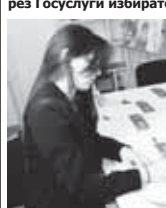
Гражданин принимает участие в электронном голосовании.

Принять участие в голосовании и выбрать кандидатов, которые представят партию на выборах в Госдуму, могут зарегистрированные через Госуслуги избиратели.