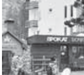
Ольга КЕРТИЕВА