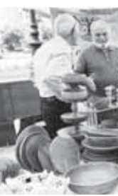
Участники форума «Креативный Эльбрус».

После пленарной дискуссии «Как локальным брендам стать успешными?» работа первого межрегионального форума «Креативный Эльбрус» продолжилась в формате тематических секций. Участники обсуждали брендинг территорий, развитие сообществ, креативное лидерство, предпринимательские инициативы и механизмы взаимодействия между культурной сферой, туризмом и бизнесом.