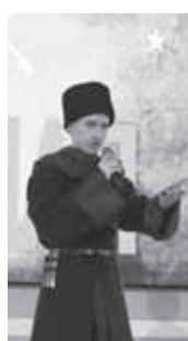
Памятные мероприятия в этот день проводятся в более чем 50 странах мира, где проживает многочисленная адыгская (черкесская) диаспора – в Турции, Сирии, Иордании, Германии, США, Франции, Израиле и других государствах.

В Кабардино-Балкарской Республике – в трёх городских округах и десяти муниципальных районах – проходит памятные и просветительские мероприятия. В канун памятной даты в Кабардино-Балкарском государственном университете им. Х. М. Бербекова, в Центре культуры им. Х. С. Темкирова прошло большое молодёжное мероприятие, организованное управлением по воспитательной работе вуза и центром адыгской культуры Социально-гуманитарного института КБГУ.