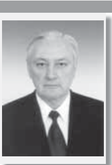
До этого Хачим Мухамедович в течение почти трёх десятков лет трудился в сфере строительства, в том числе некоторое время преподавал в Кабардино-Балкарском государственном университете, который он сам окончил в 1963 году, получив диплом инженера-строителя.

Потом была учёба в аспирантуре Московского инженерно-экономического института им. С. Орджоникидзе и там же защита диссертации на соискание учёной степени кандидата экономических наук.