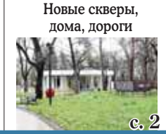
Новые скверы, дома, дороги