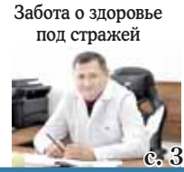
Забота о здоровье под стражей