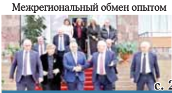
Межрегиональный обмен опытом