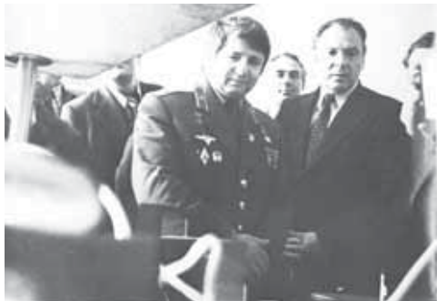
Ю. Глазков на заводе СКЭП

Цель масштабного исследования – оценить потенциал традиционных кавказских микроорганизмов для поддержания здоровья космонавтов в ходе длительных полётов. Учёные из Кабардино-Балкарского государственного университета им. Х. М. Бербекова, Института медико-биологических проблем РАН, Северо-Кавказской государственной академии и Института развития биотехнологий проверят, изменились ли генотип и фенотип грибов и сохранили ли они способность восстанавливать микрофлору кишечника в экстремальных условиях космоса.