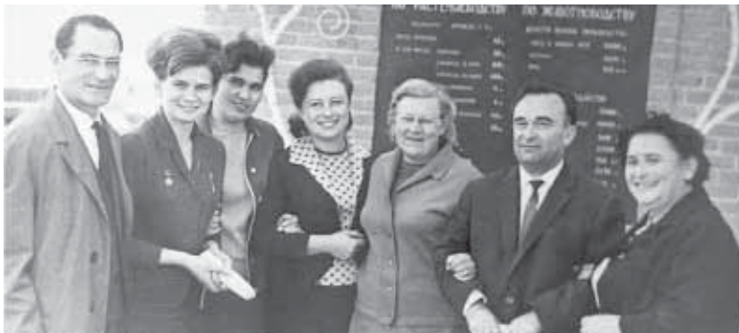
В. Терешкова в КБР

Далеко не каждый знает, что в столице Кабардино-Балкарии есть настоящая Аллея космонавтов и располагается она в центре города, рядом с Домом Правительства КБР.