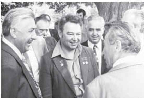
Г. Гречко в КБР

Здесь нет памятников, здесь к небу возносятся деревья, напоминающие ракеты, символизирующие полёт. Закладка аллеи в честь лётчиков-космонавтов более полувека назад стала знаком признательности покорителям Вселенной за достижения советской космонавтики и вклад лётчиков-космонавтов в развитие науки и техники. Сегодня она – живой символ космического триумфа, народной гордости нашей страны и преемственности поколений.