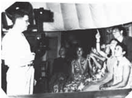
Планетарий в КБГУ 1962 г.

В частности, физики КБГУ тесно работали с группой члена-корреспондента РАН В. М. Костикова из Научно-исследовательского института конструкционных материалов на основе графита (НИИГрафит).