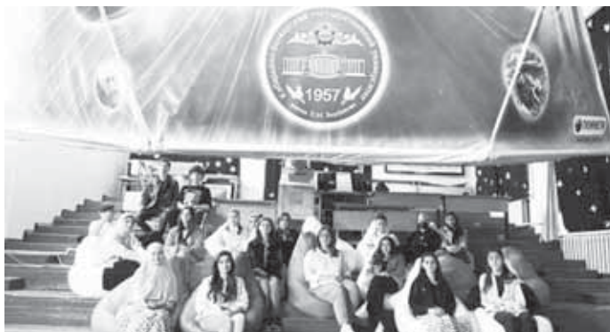
Планетарий в КБГУ. Наши дни