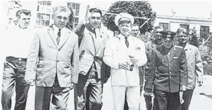
А. Леонов на заводе СКЭП

На обеспечение приоритета в освоении космоса работала вся страна. Основания для гордости за данный успех имеет и Кабардино-Балкария, которая с самого начала принимала активное участие в оснащении космических кораблей. Многие конструктивные элементы изготовлены из «звёздных» металлов – вольфрама и