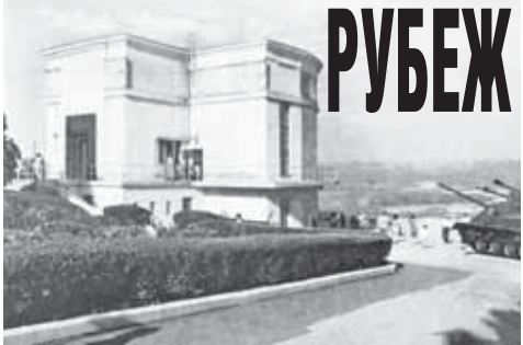
жизни открывает проход к вражескому блиндажу. Мы спускаемся со смотровой площадки в полной тишине. Слова в таких случаях излишни. Впоследствии, как сказал один из наших друзей, «мы поднимались туда как беззаботные студенты, которые от сессии до сессии живут довольно

В нашем замечательном советском студенчестве мы могли себе позволить после летней сессии целой группой сорваться и поехать в любую точку нашей необъятной страны, которая называлась Союз Советских Социалистических Республик. Сегодня хочу рассказать вам об одной такой поездке в Крым, перенесшейся в наш мир, наше представление о Великой Отечественной войне, о подвиге единого советского народа в этой жестокой битве, и заставившей повзрослеть нас в течение получасовой экскурсии. А вспомнилась эта история в связи с сегодняшней датой – 8 апреля 1944 года началась операция по освобождению Крыма.