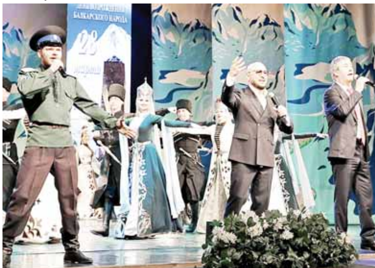
(Окончание на 9-й с.)

Вчера в Государственном музыкальном театре Кабардино-Балкарской Республики состоялся концерт, приуроченный к Дню возрождения балкарского народа.