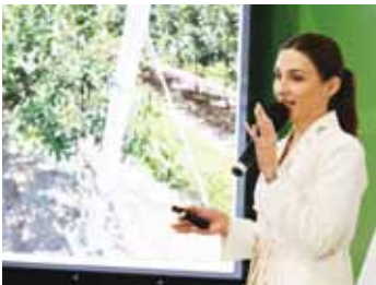
...и аграрная наука тоже. В том числе и в сфере инновационного садоводства.