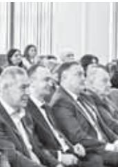
В ходе заседания обсуждались итоги работы отрасли.

Торжественная церемония открытия тематического года состоялась в Государственном музыкальном театре. В течение года в учреждениях культуры республики реализовывалась культурно-просветительская деятельность организаций отрасли.