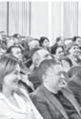
Торжественная церемония открытия тематического года.

По словам руководителя ведомства, работа министерства в 2025 году строилась в нескольких ключевых направлениях. В их числе – реализация мероприятий нового национального проекта «Семья», укрепление материально-технической базы учреждений культуры, поддержка профессионального искусства и народного творчества, а также содействие развитию молодых талантов.