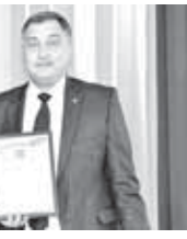
Заседание коллегии Министерства культуры.

По словам руководителя ведомства, работа министерства в 2025 году строилась в нескольких ключевых направлениях. В их числе – реализация мероприятий нового национального проекта «Семья», укрепление материально-технической базы учреждений культуры, поддержка профессионального искусства и народного творчества, а также содействие развитию молодых талантов.