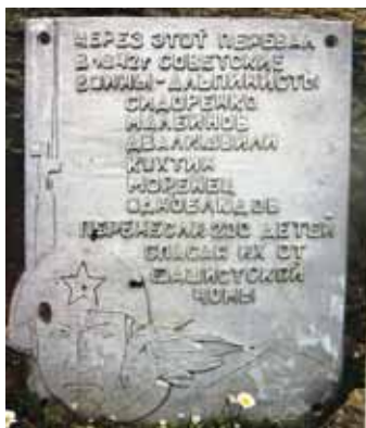
Обелиск на перевале Бечо