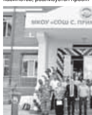
«Земский учитель». Все это направлено на формирование сильного, образованного и социально ответственного поколения.

В районе прошли значимые мероприятия, в том числе съезд казачьей молодёжи, получивший широкий отклик и освещение в средствах массовой