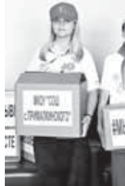
Виктор ШЕКЕВОВ Фото автора