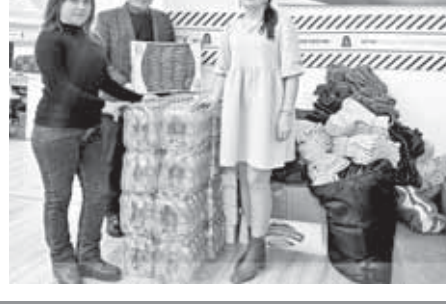
Виктор ШЕКЕВОВ Фото автора