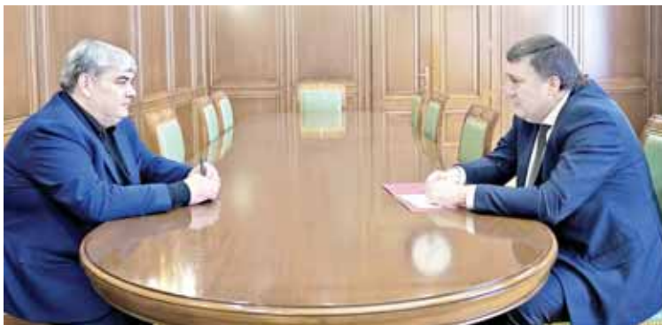
Обсуждались итоги прошедшего года, в особенности реализация противопаводковых мероприятий и планы на ближайшую перспективу.