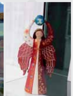
А. Езиева. «Единство народов»

любовью и взаимопониманием. Юные художники видят в семейных традициях не просто ритуалы, но и живые нити, связывающие поколения. Они запечатлевают тепло объятий, блеск глаз, улыбки - все то, что делает семью настоящей опорой.