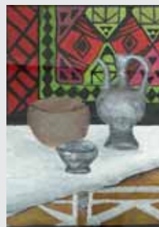
М. Аппаева. «Наследие предков»

Особое место в их творчестве занимают семейные традиции. Это могут быть изображения семейных праздников, уютных вечеров у камина, совместных путешествий или просто моменты, наполненные