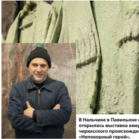
В Нальчике в Павильоне современного искусства открылась выставка американского художника черкесского происхождения Зака КАХАДО «Непокорный герой».