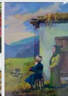
Р. Шукова. «Теплое утро»