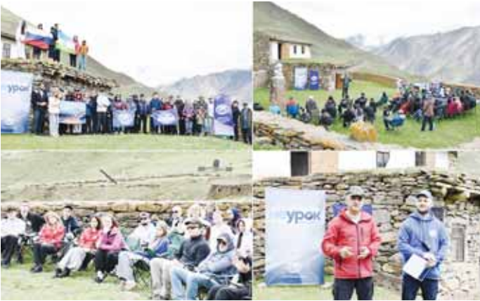
В Черекском районе среди развалин высокогорного аула Шыки началось ежегодное просветительское мероприятие Русского географического общества под названием «Неурок географии».

На одной из самых высокогорных местностей России собрались члены регионального отделения Русского географического общества, представители Молодежного движения РГО Кабардино-Балкарии, органов государственной власти, общественных объединений, представители средств массовой информации и гости республики.