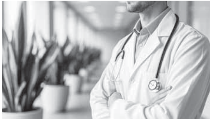
Минздрав РФ с 4 по 10 мая объявил неделю здорового долголетия. Это информационно-профилактическая акция, направленная на популяризацию активного образа жизни и профилактики возрастных изменений. Основная цель - увеличение ожидаемой продолжительности жизни до 78-80 лет за счет борьбы с болезнями и формирования полезных привычек.

с небольшим весом помогают сохранить мышечную массу. Главное - выбрать то, что приносит удовольствие, и заниматься регулярно хотя бы тридцать минут в день. Здоровый сон тоже играет большую роль: во время сна организм восстанавливается, а мозг обрабатывает полученную за день информацию. Недостаток сна повышает уровень стресса, ослабляет иммунитет, увеличивает риск гипертонии и диабета. Чтобы сон был качественным, полезно ложиться и вставать в одно и то же время, избегать гаджетов за час до сна, создать в спальне темную и прохладную атмосферу. Взрослому человеку нужно семь-девять часов сна в сутки.