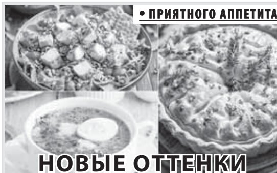
• ПРИЯТНОГО АППЕТИТА