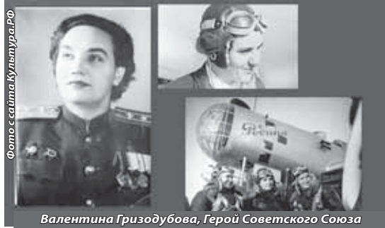
Валентина Гриздобова, Герой Советского Союза

В адрес комитета приходили письма поддержки от Клементины ЧЕРЧИЛЛЬ, супруги премьер-министра Великобритании, председателя фонда Красного Креста России, совета женщин Голливуда, женщин-бойцов Первого чехословацкого армейского соединения, Американской ассоциации женщин с университетским образованием, Мексиканского совета учителей и многих других организаций. Безусловно, в этом огромную роль сыграла личность самой В. Гриздобовой. Ее героическая биография и недюжинные дипломатические способности стали примером и оказали значительное влияние на развитие женского движения не только в нашей стране, но и за рубежом.