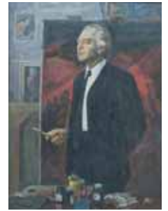
Портрет художника, 1974