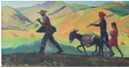
«На сенокос», 1967

Его кисть оживила целую галерею портретов простых рабочих, занятых на производстве и в поле, среди которых стоит отметить большое количество женских образов. Его мастерство проявилось в поразительной точно-