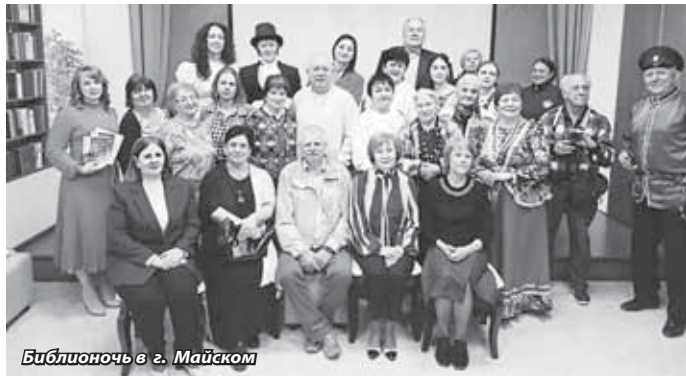
Библионочь в г. Майском

кую сказку «Кукушка», раскрывающую мудрость северных районов.