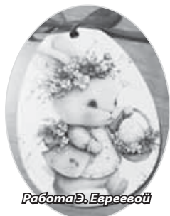
Работа Э. Евревой

Пасхальное рукоделие - это создание уютного декора своими руками. К нему можно отнести крашение яиц (декупаж - наклеивание на вареные или деревянные яйца красивых салфеток с цветочным мотивом с помощью яичного белка или клея ПВА, роспись - создание узоров акриловыми красками, маркерами или свечным воском). Можно изготовить декор с использованием нитей и лент: обмотанные яиц декоративным шнуром, кружевом или атласными лентами. Еще один вид рукоделия - это создание пасхальных венков, корзинок из фетра, игрушек из лыка, бумажных гирлянд и композиций с искусственной травой. Для пасхального венка изготавливается основа из лозы или пенопласта, украшенная искусственными цветами, мхом, перепелиными яйцами и перьями. Популярны также весенние букеты (тольпаны, нарциссы), тематические открытки и украшения куличей. Не менее красивы композиции в корзинке: стеклянная чаша или корзина, наполненная искусственной травой, искусственными цветами и окрашенными яйцами. Пасхальное дерево представляет собой сухие ветки в вазе, украшенные подвесными яйцами из фетра, картона или папье-маше. Рукоделие из фетра и текстиля представлено