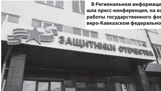
В Региональном информационном центре «ТАСС Кавказ» прошла пресс-конференция, на которой подвели итоги трехлетней работы государственного фонда «Защитники Отечества» в Северо-Кавказском федеральном округе.

Большинство трудоустроенных ветеранов стали индивидуальными предпринимателями, работают в государственных или муниципальных учреждениях или на частных предприятиях. Примерно половина из них также занимается личным подсобным хозяйством. Руководитель филиала выразил желание, что-