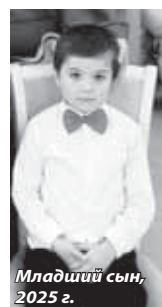
Младший сын, 2025 г.