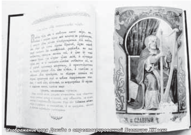
Изображение царя Давида в отреставрированной Псалтири XIX века

- Конечно, содержанием. В ней всегда поднимаются вопросы духовности, души и нравственности. Православная книга учит, воспитывает и очищает душу человека. Но, как вы понимаете, такой может быть не только книга, например, о вероучении, но и художественная литература, если ее