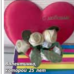
Валентинка, которой 25 лет