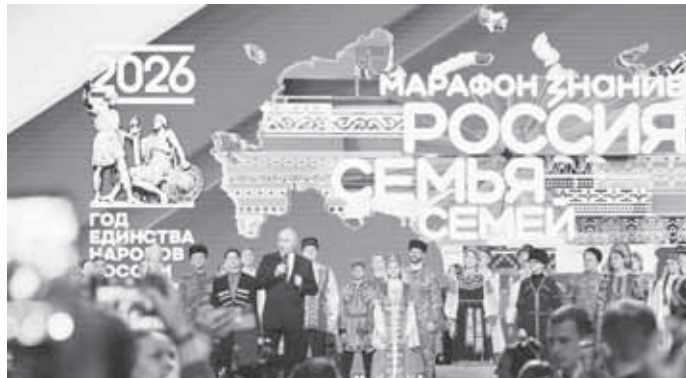
Торжественное мероприятие состоялось в Национальном центре «Россия» на Краснопресненской набережной в Москве в рамках просветительского марафона общества «Знание» «Россия – семья семей».

Марафон «Россия – семья семей» призван показать силу, потенциал и гармонию народов России, позволить каждому почувствовать себя частью большой единой семьи. Для четырех тысяч молодых людей – представителей более 190 народов РФ и иностранных гостей организованы лекции, мастер-классы, выставки и кинопоказы. Главным событием станет торжественное открытие Года единства народов России, церемония охватит все регионы