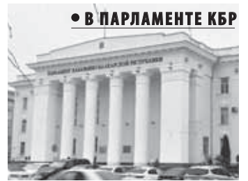
• В ПАРЛАМЕНТЕ КБР

Изменения коснулись и республиканского закона «Об организации проведения капитального ремонта общего имущества в многоквартирных домах». Документ представил председатель комитета по строительству, жилищно-коммунальному