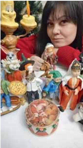
ГОЛОВА ИЗ ВАТЫ...

- Увлечение рукоделием пришло ко мне не сразу. Может быть, на это каким-то образом повлияла профессия мамы, она - кондитер, а в этой профессии красота оформления имеет большое значение. Потом сестра начала делать своими руками эксклюзивные бантики и заколки для волос, я тоже хотела найти свое призвание. Долго не могла определиться, пока на просторах интернета не увидела эту красоту - ватные елочные игрушки, решила тоже попробовать.