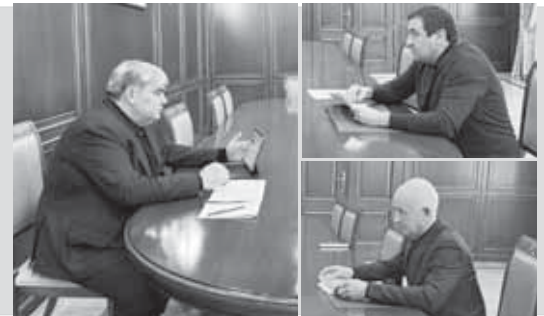
На днях Глава БР Казбек КОКОВ провел две рабочие встречи – с министром здравоохранения республики Русланом КАЛИБАТОВЫМ и министром экономического развития республики Борисом РАХАЕВЫМ.

Речка, детской поликлиники в Чегеме, поликлиники в Заюково и т.д. Также планируется начать возведение нового хирургического корпуса ЦРБ Баксанского района.