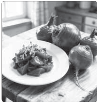
Халхъэхэр (зы цыкху лыхъэ): жэгундэ пльыжь гъэвауэ грамм 200, шатуу грамм 50, бжыныхуу грамм 5, шыгуу зыхуейм хуэ- диз.

Халхъэхэр: жэгундэ пльыжь мыукъэбзауэ грамм 400, зэрагъэвэн псыуэ грамм 1500-рэ.