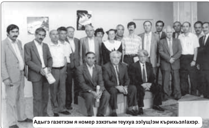
Адыгъ газетхэм я номер зэхътым теууха зӀлушӀэм кӀрихьӀлӀахэр.