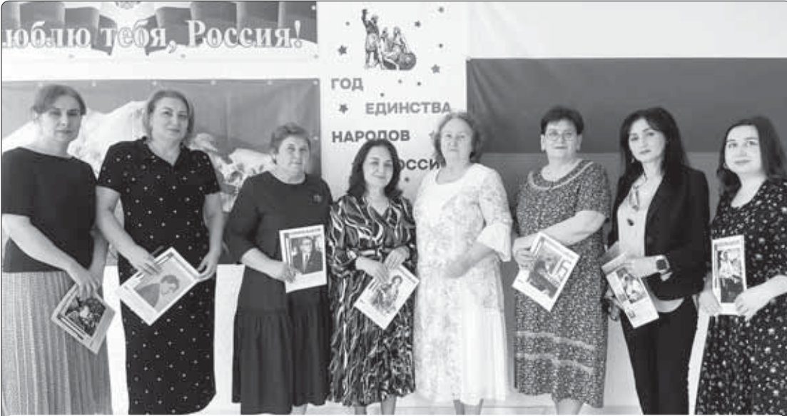
Шыд Хьэзрит и цэр зэрхьэу Нарткьалэ дэт курыт школ №2-м (унафэщыир Шыбыхьэуэ Иннэщ) урысыбзэмр литературэмкIэ и егъэджакуэуэр щIэблэм я унэтIакуэуэ нэщ. Ахэр зи кьалэным кьызыхуэтыншэу пэлъэщ, IэнатIэм ехуэлIэныгъэ лъагэхэр шызыIэрызыгъэхьэ лэжьакуэуэ пашэхэщ.

Урысей Федерацим и мызакъуэу, хамэ щыналъэ куэдми нобэ цагъэлапIэ Урысыбзэм и дунейпсо махуэр. «Лъэпкъныгъэшхуэ зыбгъэдэлъ бзэ къулей икIи купцIафIэ», - апхуэдэ псалъэхэр урысыбзэм хужилаш тхакIуэ, бзэ щIэныгъэлI цIэрылуэу, этнографу шыта Даль Владимир. Абы и псалъэхэм я шыхьэтц урысыбзэмкIэ нобэкIэ псалъуэ, а бзэр хумту ягъэшэрыуэ ягурылуэ дунейм тет цIыхуэхэм ящыщ мелуан 260-м щIигъу зэрыщыIэр. Урысыбзэр кьэралыбзэу кьыщалъэ Урысей Федерацим, Кьэрал Шхьэхумтхэм я Зэгухьэныгъэм (СНГ) хьыгъэ зхуэ зыбжанэм, Абхъэзым, Осетие Ипщэм. А бзэмкIэ шызэрощIэ, щызопсалъэ СССР-м хьыгъуэ шыта кьэралхэм шыпсэхуэр, Чехием, Болгарием, Латин Америкэм, Новая Зеландием, Африкэм, нэгъуэщI цIыпIэхэми шыщ куэд.