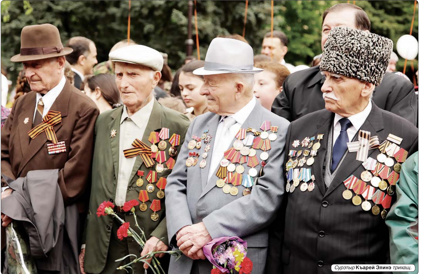
Сурэтър Къарей Элинэ трихаш.