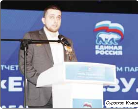
Сурэтхэр Къарей Элиня трихаш.