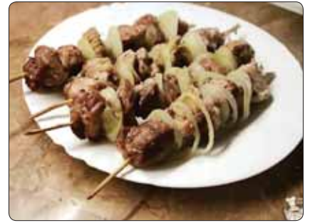
яухохуэ псчэрэйхэм, лупс бзаджэ зIлэхэм, шыIэ зыхыяхэм.

Дащх пастэ, мырамысэ, чыржын, хъэлIамэ, цIакхуэ. Шэ хуабэ трафыхыж. Сэбэпышхуэ