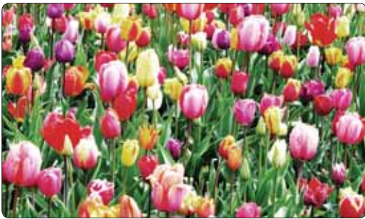
Тюльпаныр гъатхэм и нэщэнэ удз гъэгъа гуаклуэщ. Гъатхэлэм и 8-м, Цыхубэхэм я махуэм, бзыльхугъэхэм нэхъыбэу зэрэхуэупсэр аращ.

АР ди къэралым къытхуизышар, абы нэлуасэ дыхуэзыщлар пащтых Петр Езанэрщ. И зыплъыхъаклуэ зеклуэхэм язым абы Урысейм къышаш нэхъапэкIэ щыпIэм шамылгъэгуа удз гъэгъа земылIэужыгъэу куэд. Тюльпаныр абыхэм ящыщ зыт.