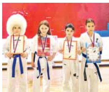
Кыонокылары бир кыуамун, ол санда СВО-га чакьышканы аскериле да алгышлуу селерин айтхандыла.

Ол отуз эки шахарны ичинде Кышхатау да бар эди. Озганы ыяхк юн анда Физкультура-саулукуландыруу комплекседе кйюсюнкай каратеден эришуиле этгендиле. Анга уа Кыбарты-Малкьардан, Кыарай-Черкесден, Ингушетиядан