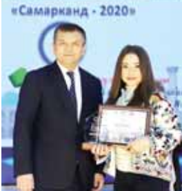
«Самарканд - 2020»

Жыны ахырында хар заманда да университетде халкыла аралы олимпиада бардырылады. Быйын да анга кеп кыралланы келечилери кытышандыла. Бу юндеде да университетде медицина вузуну студенттерин араарында 6-чи халкыла аралы «Samarqand-2020» олимпиада этгенди. Анга Россейден, Тюркден, Ин-