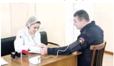
чула быллай ишлеге дайым да кыатышдыла. Бу жон а сынаулу донорлагы кыанларын анычлиги кер берилгене да кыораткандыла. Аны элденде уа барыны да тийишли медицина тинтуилерден этгендиле, — деп билдиргендилик бизге КЭМР-де

МВД-ны пресс-службасындан. Медицина учуреденинни оюучулары полициячыла кыаны кыстыргыны кыуаргага болушканын ючюн ырызлыкыларын айтхандыла.